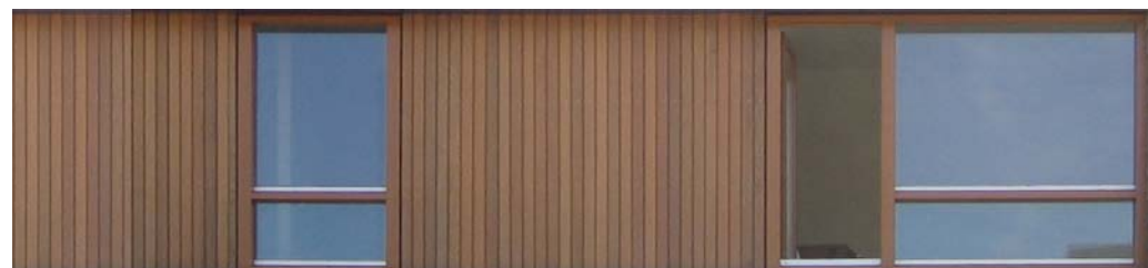
Afbeelding 5: Accenten of verbijzonderingen mogen worden uitgevoerd in afwijkende natuurlijke materialen zoals hout, staal, stuc en glas in natuurlijke tinten, die complementair zijn aan de gekozen steenkleur. Accenten of verbijzonderingen zijn ondergeschikt aan het hoofdgevelmateriaal.

In overleg met de architect van bouwveld SSK5a en SSK5b en het bewonersplatform Simon Stevin is ingezet op een kleur- en materiaalkeuze die aansluit bij de al aanwezige architectuur in SSK5a en de geplande architectuur in SSK5b.