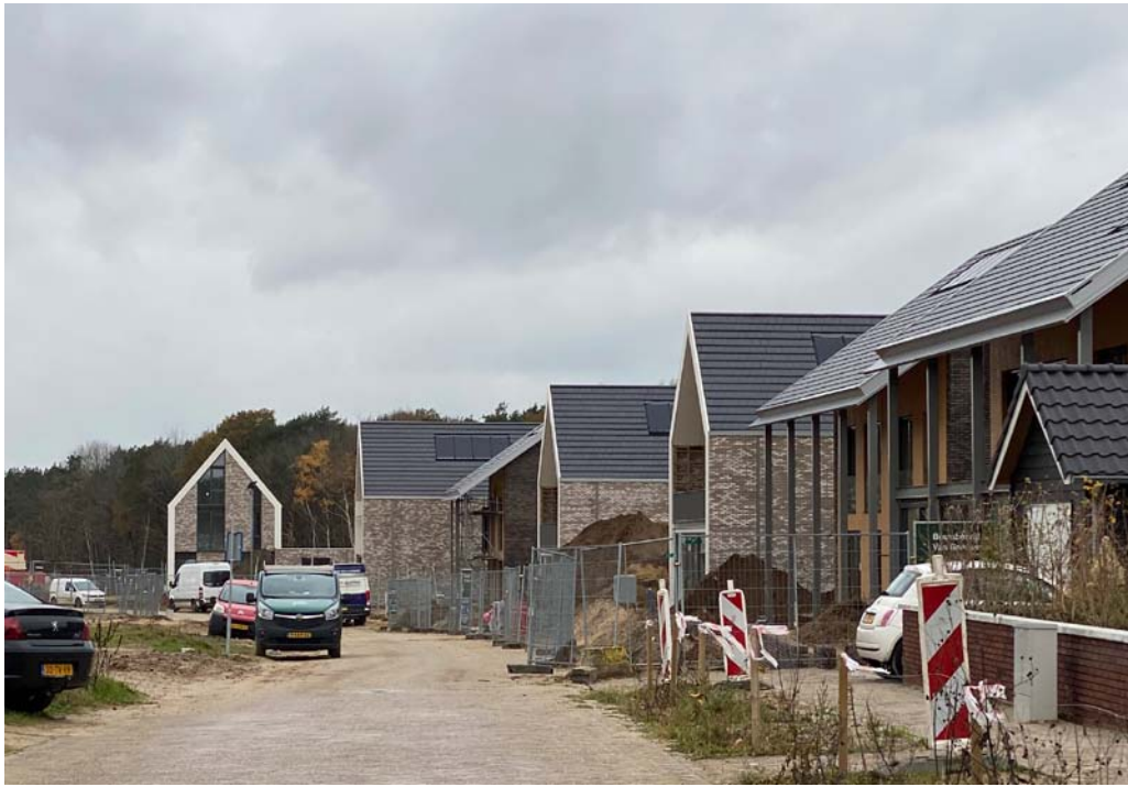
Afbeelding 2: reeds gerealiseerde woningen op SSK 5a