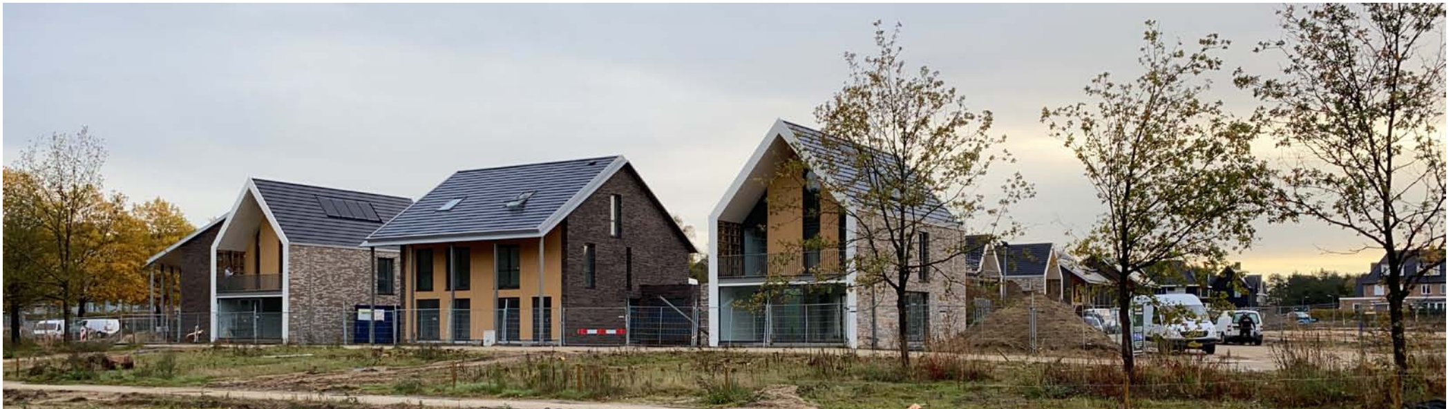
Afbeelding 3: reeds gerealiseerde woningen op SSK 5a

In deze voorliggende appendix is, in aanvulling op het bestaande beeldkwaliteitsplan, alleen een kleur- en materiaalrange vastgelegd, teneinde een minimale mate van samenhang te borgen in de woningen die worden ontwikkeld op de vrije kavels en de omliggende projectmatig ontwikkelde woningen. Op deze manier heeft de Commissie Ruimtelijke Kwaliteit (CRK) toetsingshandvatten om een minimale mate van samenhang te borgen, terwijl de kopers van de vrije kavels, binnen de bestaande kaders van het beeldkwaliteitsplan en bestemmingsplan, maximale architectonische vrijheid behouden om hun droomhuis te ontwikkelen.