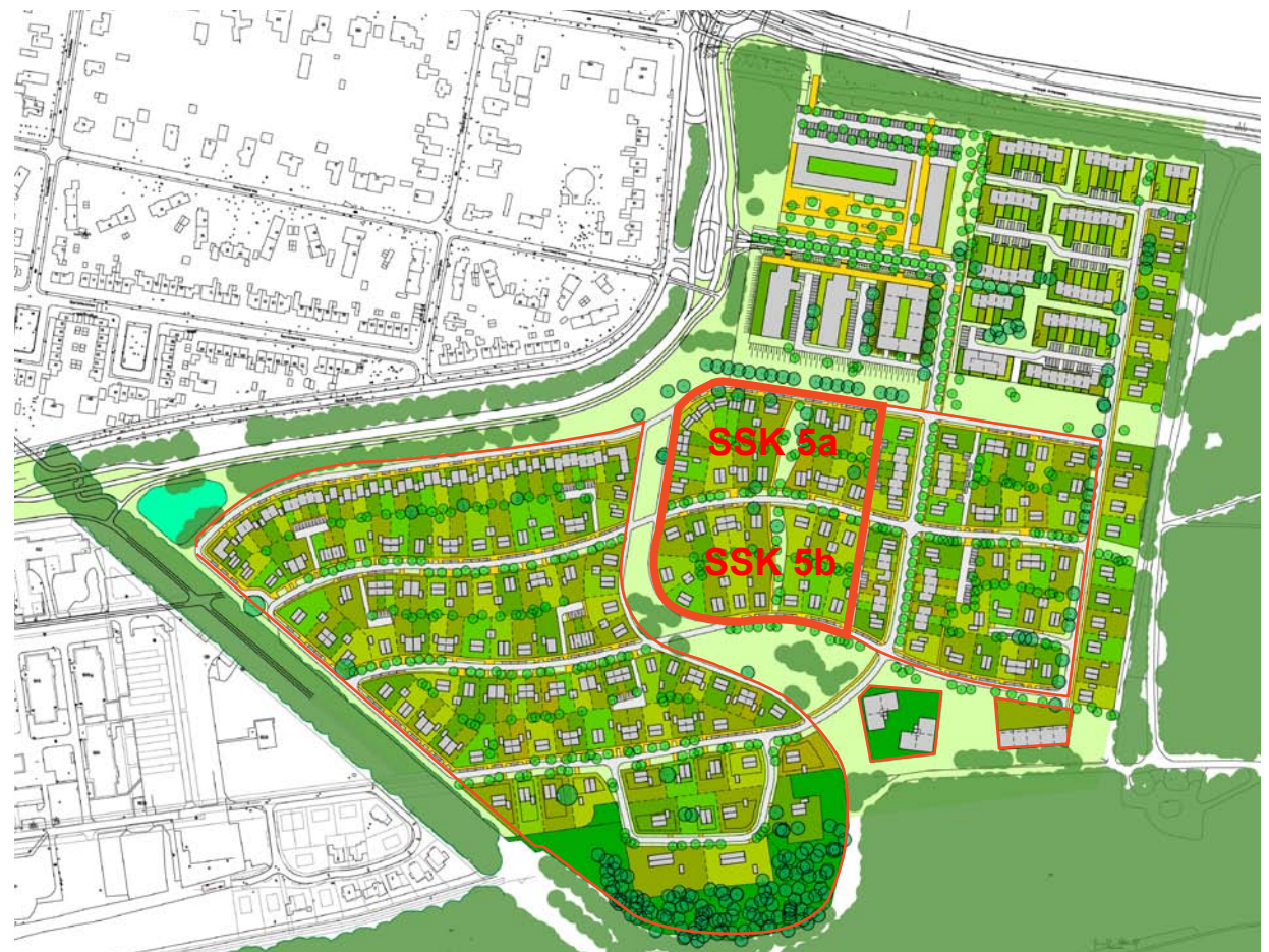
Afbeelding 1: Proefverkaveling deelgebied de Lanen met bouwveld SSK 5a en SSK 5b daarbinnen