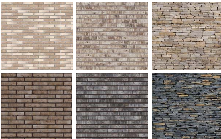
Afbeelding 4: gevels bestaan hoofdzakelijk uit baksteen of natuursteen in aardetinten. Het kleurgebruik valt binnen bovenstaande range van lichte zandkleurige tot donker bruine aardetinten.